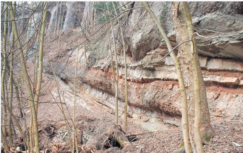
Für das Erdwärme-Projekt der Stadt St. Gallen sollen wasserführende Gesteine des tiefen Untergrundes genutzt werden. Diese Gesteinsschichten sind im ganzen Gebiet des zentraleuropäischen Alpenvorlandes verbreitet und können auch an der Oberfläche beobachtet werden.

Redaktion: Fachstelle Kommunikation, Amt für Umwelt und Energie infoerdwaerme@stadt.sg.ch, www.erdwaerme.stadt.sg.ch