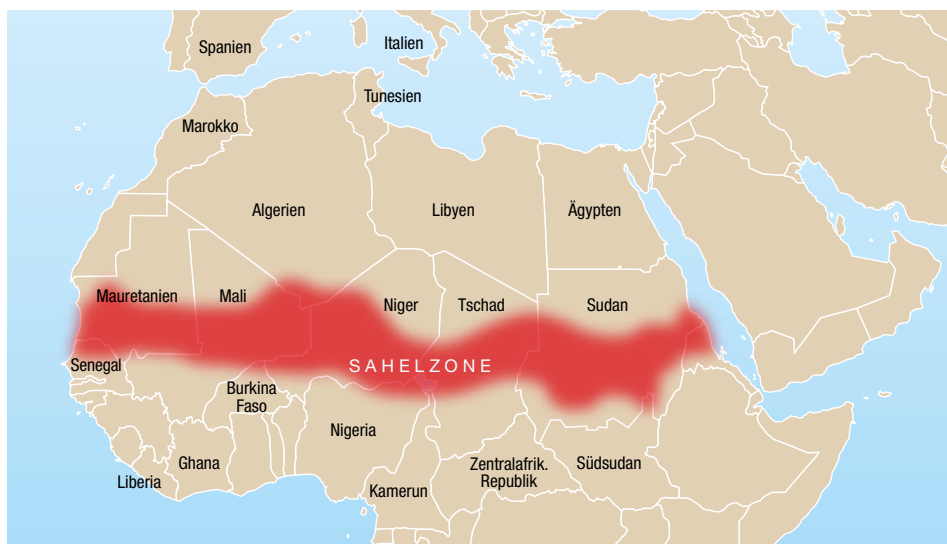
Sahelzone: Afrikas trockener Gürtel

auf Nahrungsmittelhilfe angewiesen, während gleichzeitig im Westsahel 600 000 Menschen Opfer von Überschwemmungen wurden. 2012 waren weit mehr als 10 Millionen Menschen im westlichen Sahel von einer Hungersnot betroffen. Im Juni 2013 verwies die EU darauf, dass es «in der gesamten Sahelzone zu einer schweren Ernährungskrise kommen wird» und über vier Millionen Kinder von akuter Unterernährung bedroht seien. Ohne schnelle Anpassungsleistungen wird sich die Wüste in schnellen Schritten weiter ausbreiten, wird sich gesellschaftliches Leben in weiten Teilen des Sahel grundlegend verändern.