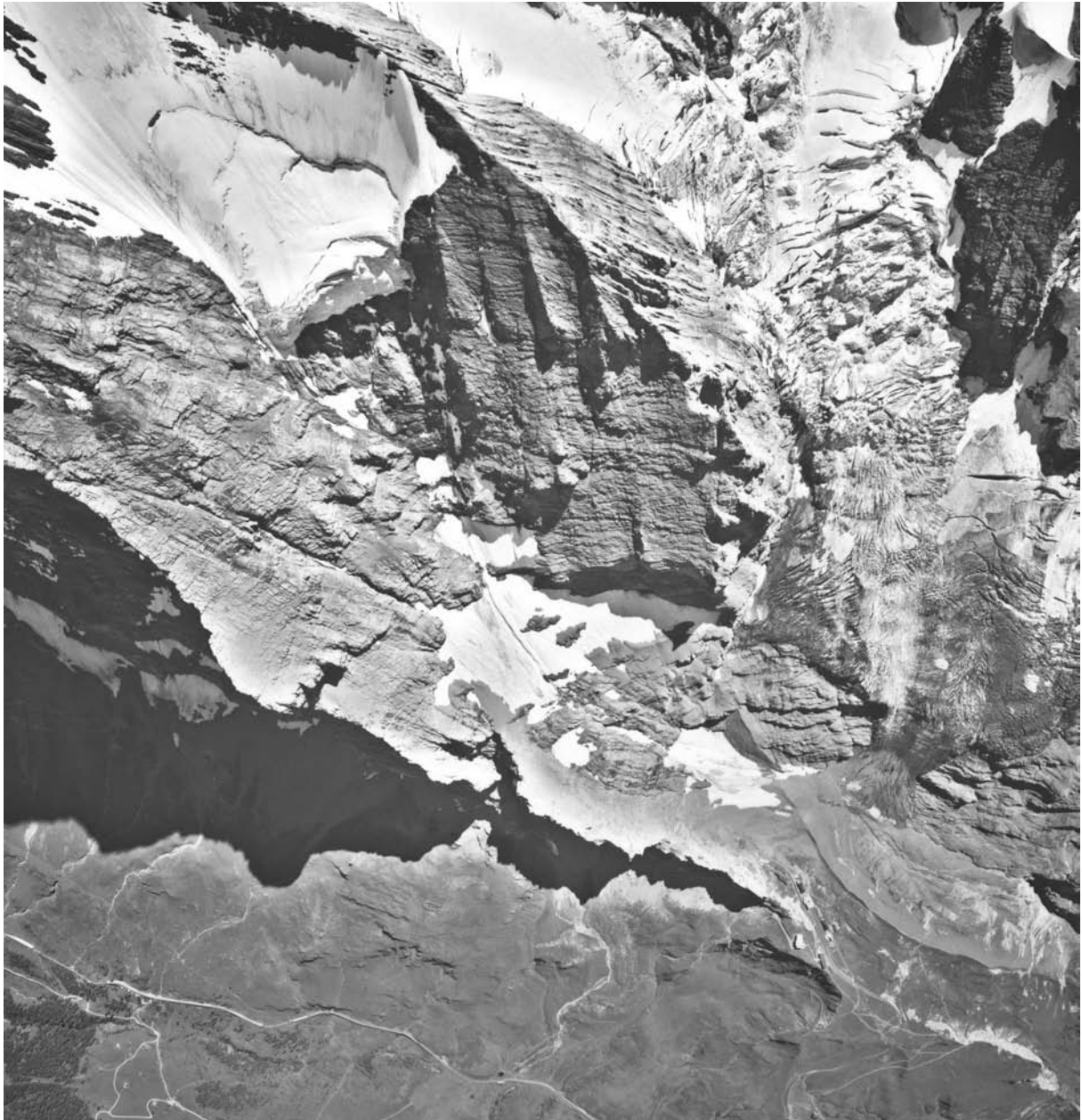
Abbildung 2: Luftbild des Eigerhängegletschers (links) und Eigergletschers (rechts) am 23. August 2001.