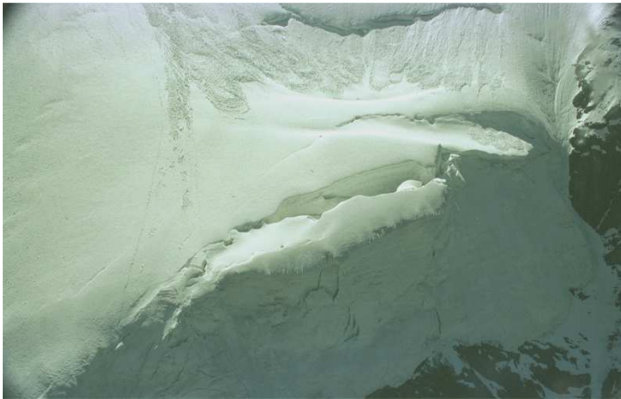
Abbildung 1: Labile Eislamelle an der Front des Eigerhängegletschers im Juli 2001. Solche Lamellen brechen regelmässig (ca. alle 1-2 Jahre) ab.