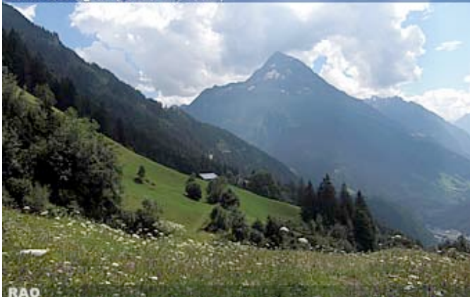
Chilcherbergen (Uerner Reusstal)