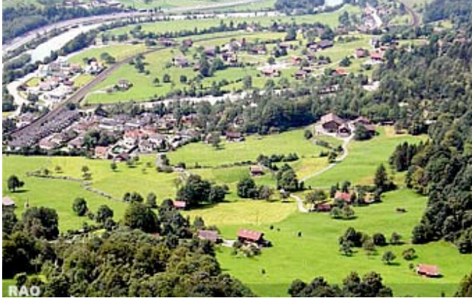
Talhöfe in der Region Silenen - Erstfeld Uerner Reusstal